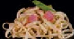
K26. Bami Goreng €3,00