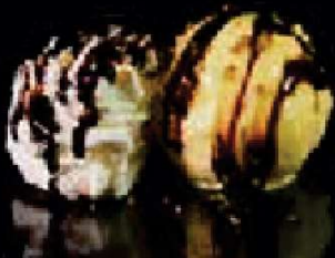
G4. Bananenijs €3,50