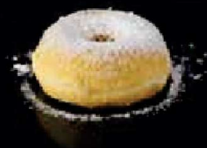
G9. Mini Donut Niet beschikbaar