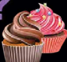
G10. Verrassing €4,00