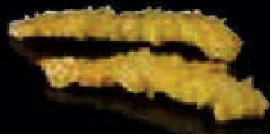
F6. Ebi Tempura Garnalen €4,00