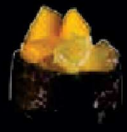
B4. Mango Aloë Vera € 2,30