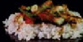
H15. Unagi Kabayaki