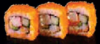
C8. California Maki