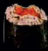
B6. Tonijnsalade €2,30