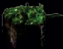
B2. Chuka Wakame Zeewier €2,30