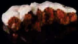
F1. Tori Katsu Kipschnitzel €4,50