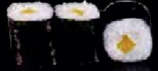
C4. Oshinko Maki