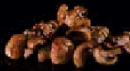
H11. Mushroom Yaki