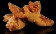
F4. Pangsit Goreng Gebakken deeg met vlees €3,00