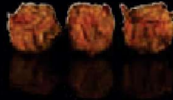
F3. Siew Maai Kip pasteitjes €3,00