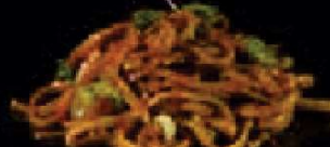
K27. Ma Lai Mie Vegetarische bami in ketjap €3,00