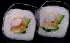
C6. Futo Maki