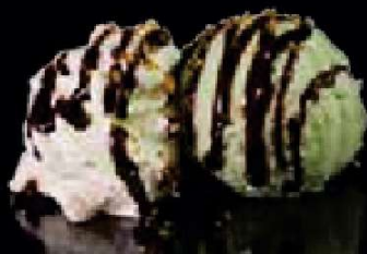
G5. Groene Thee ijs €3,50