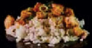
H16. Yaki sake Chāhan