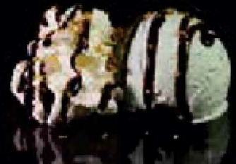
G3. Pistache ijs €3,50