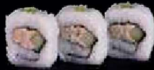
C10. Tuna Maki