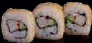
C13. Crispy Roll