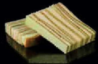
G6. Spekkoek Pandan €3,00