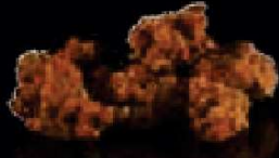
F2. Spicy Chicken Pikant krokante kipfilet €4,00