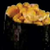
B3. Maïs €2,30