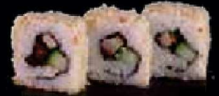
C12. Chicken Maki