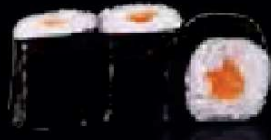
C2. Sake Maki