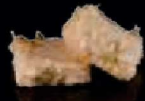
F8. Agedashi Tofu €3,50