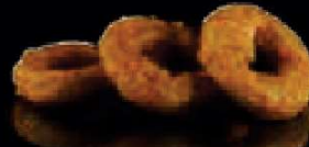
F7. Ika Tempura Inktvisringen €4,00