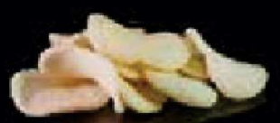
K28. Kroepoek €3,50