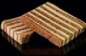
G7. Spekkoek Original €3,00