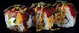
C16. Merlina Maki Beef

Roomkaas en geflambeerde ossenhaas €4,00