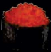
B1. Masago Viskuit €2,50