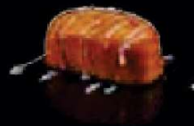
F14. Sweet Bun Zoet broodje €2,50