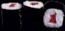
C1. Tekka Maki