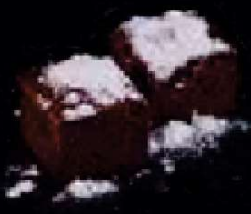
G8. Mini Brownie €2,50