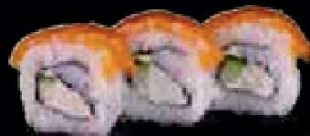
C14. Salmon Cream Cheese