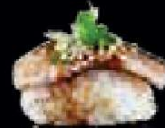
A13. Tetaki Tuna Geflambeerde tonijn €2,60