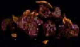
H1. Gyu Niku Yaki