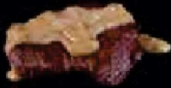
H2. Ossenhaas Roomsaus