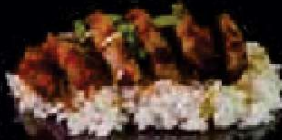
H14. Chicken Shōyu Chāhan