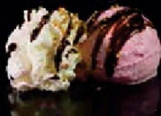
G2. Aardbeienijs €3,50