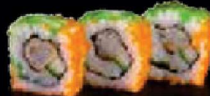
C11. Tempura Maki