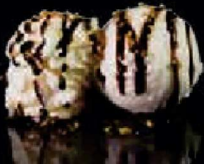
G1. Vanille ijs €3,50