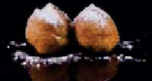
F12. Pisang Goreng Gebakken banaan €2,50