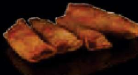
F10. Haru Maki Mini loempia €3,00