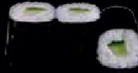
C3. Kappa Maki