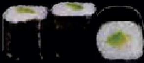
C5. Avocado Maki