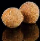
F13. Dragon Balls Zoete rijstbal met sesamzaad €2,50