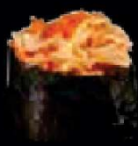
B5. Krabsalade €2,30