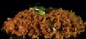
K25. Nasi Jawa Indonesische nasi goreng €3,50