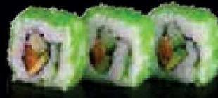
C7. Zalm Avocado